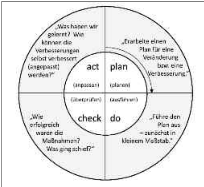
Abb. 4.1

Der Deming-Zyklus für den gesamten Qualitätsprozess sieht so aus: