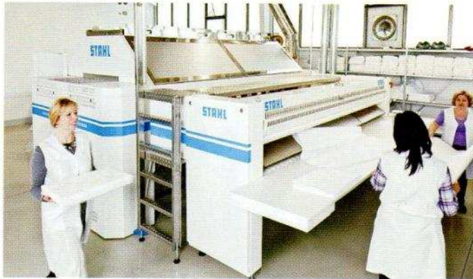
Mit der richtigen Investition in große Maschinen lasse sich in kurzer Zeit viel Wäsche bearbeiten, wie mit der großen Muldenmangel Master, die der Maschinenhersteller Stahl 2010 neu vorgestellt hat. Das spare dann effektiv Personalkosten, empfiehlt Uwe Stahl.